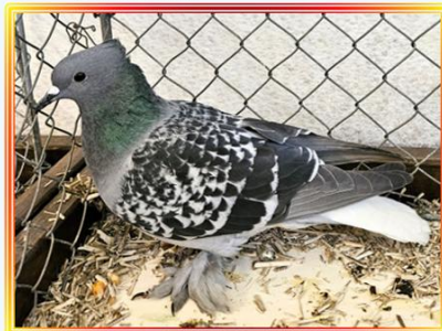
Aargauer Weisschwanz 1,0 Jung Blaueh. A. Stephan