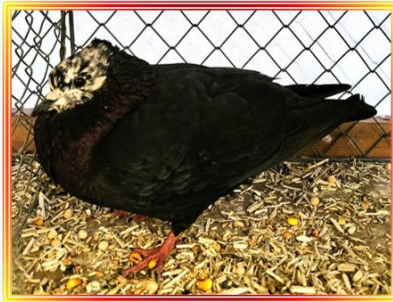
Berner Riesekopf 1,0 Alt Ch. Uebersax