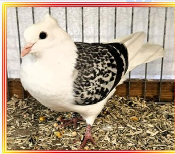
Thurgauer Schild 0,1 Alt Blaufahlgeh. V. Schmidt