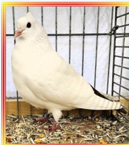
Wiggertaler 1,0 Jung Rot K. Porzel