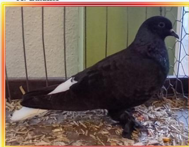
Zürcher Weisschwanz 0,1 Jung Schwarz L. Balkenhol