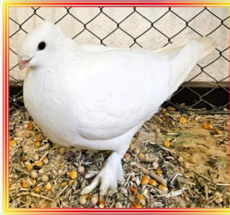
Luzerner Einfarbige 0,1 Jung Weiß L. Seiler