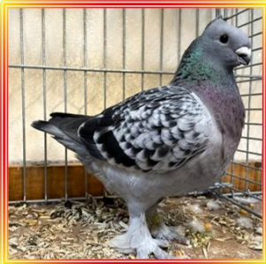
Luzerner Kupferkragen 0,1 Jung Blaugeh. R. Mildner