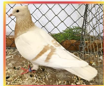
Einfarbige Schweizer Taube 1,0 Jung Gelbfahl m. g. B. A. Feller