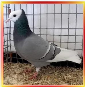
Thurgauer Mönch 0,1 Jung BLm.w.B. A. Lützner