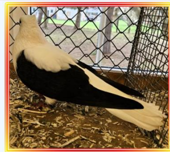
St. Galler Flügeltaube 0,1 Alt Schwarz Ch. Uebersax