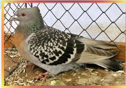
Berner Lerche 0,1 Jung H. Kaps