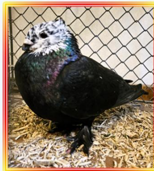
Luzerner Rieselkopf 1,0 Jung M. Klapproth