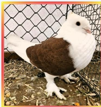
Luzerner Schild 0,1 alt Rot N. Meyer