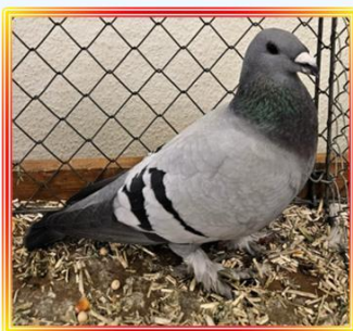
Eichbühler 1,0 Jung Blau m. s. B. H.J. Fuchs