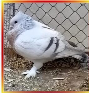
Luzerner Goldkragen 0,1 alt M.m.B. W. Pfeiffer