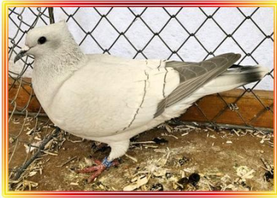
Einfarbige Schweizer Taube 0,1 Jung Eisfarbig m.B. R. Diefert