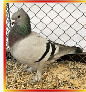
Luzerner Kupferkragen 1,0 Jung Bl.m.s.B. ZGM Lehmann/wolf