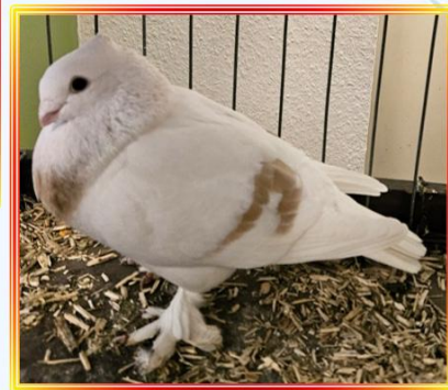
Luzerner Elmer 1,0 alt Ch. Uebersax