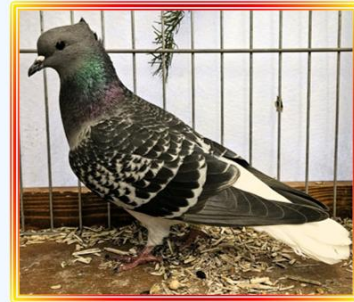
Thurgauer Weisschwanz Blaueh. 1,0 Alt E. Walser